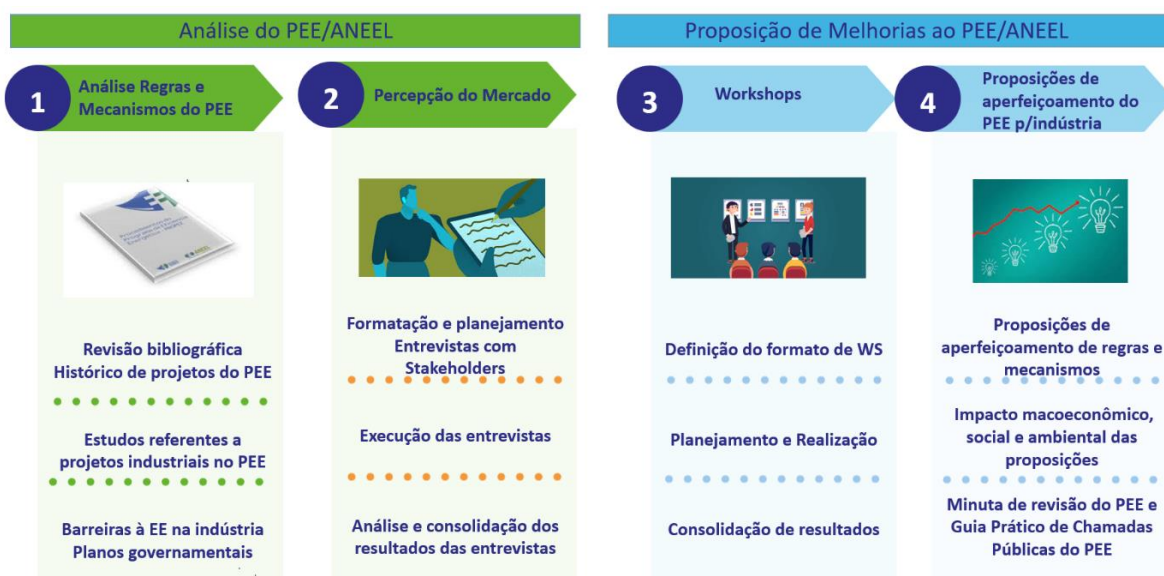
Figura 1 - Estudo de revisão e aperfeiçoamento do PEE/ANEEL

Figura 1 representa de forma sintética as atividades realizadas no estudo de revisão e aperfeiçoamento do PEE/ANEEL, com destaque para a quarta etapa na qual foram definidos, calculados e avaliados impactos econômicos, ambientais e sociais advindos das melhorias propostas no PEE/ANEEL até o referido horizonte.